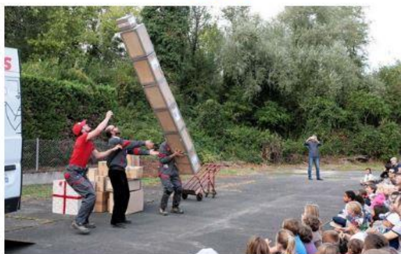
Les livreurs déjantés de la Compagnie Cirque en scène dans "Oups, la livraison d'enfer" Jean-Louis Le Bras

Par Jean-Louis LE BRAS, publié le 1 octobre 2019 à 17h19, modifié à 20h00.