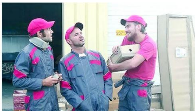
Théâtre, musique, danse et feu au programme de la clôture du Festival de l'Agglo à Praheçq ce vendredi.

CIRQUE EN SCÈNE - Centre des Arts du Cirque de Niort